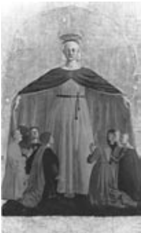
PIERO DELLA FRANCESCA Polittico della Misericordia (particolare) (1460-62)