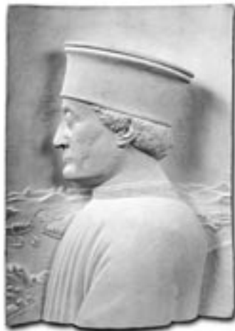
PIERO DELLA FRANCESCA Federico da Montefeltro (1465 circa)