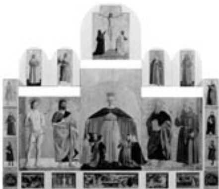
PIERO DELLA FRANCESCA Polittico della Misericordia (1445-62)

F.J. Haydn Sinfonia n. 104 "London" in Re Magg. - Adagio, Allegro - Andante - Minuetto, Allegro - Finale, Allegro spiritoso