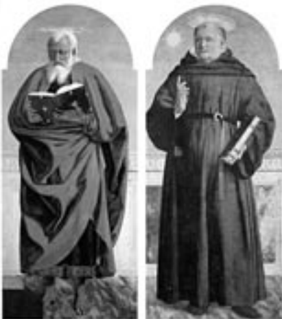
PIERO DELLA FRANCESCA Polittico di Sant'Agostino (1460-70)