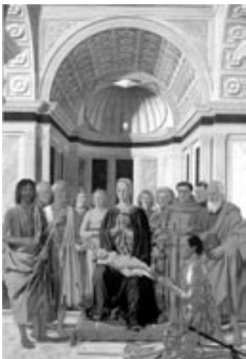
PIERO DELLA FRANCESCA Polittico di Sant'Agostino (1460-70)

J. Sibelius Sinfonia n. 2 in Re Magg. Op. 43 - Allegretto, Poco allegro, Tranquillo ma a poco a poco rinvivendo il tempo all'allegro - Tempo andante ma rubato, Molto largamente, Andante sostenuto - Vivacissimo, Lento e soave, Largamente - Lento, Finale: Allegro moderato, Molto largamente