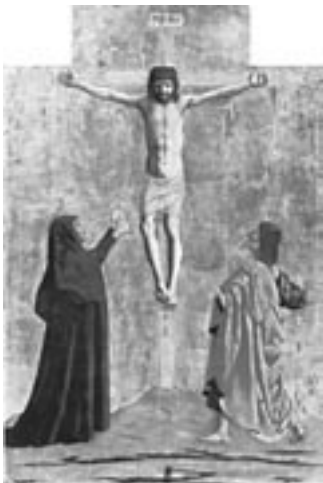
PIERO DELLA FRANCESCA Polittico della Misericordia (particolare) (1445-62)

P. I. Tchajkovskij Marcia slava Op. 31 Lo Schiaccianoci, Suite dal balletto Op. 71/a - Ouverture miniatura (Allegro giusto) - Marcia (Tempo di marcia viva) - Danza della fata confetto (Andante non troppo) - Danza russa (tempo di trepak, molto vivace) - Danza araba (Allegretto) - Danza cinese (Allegro moderato) - Danza degli zufoli (Moderato assai) - Valzer dei fiori (Tempo di valse)