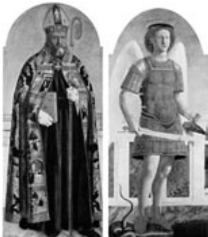
PIERO DELLA FRANCESCA Polittico di Sant'Agostino (1460-70)